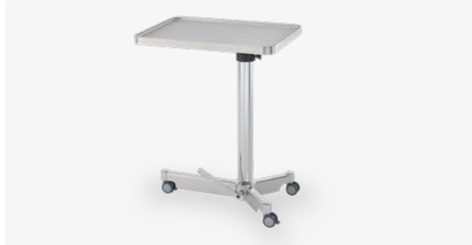
Table à instruments de chirurgie (hydraulique)