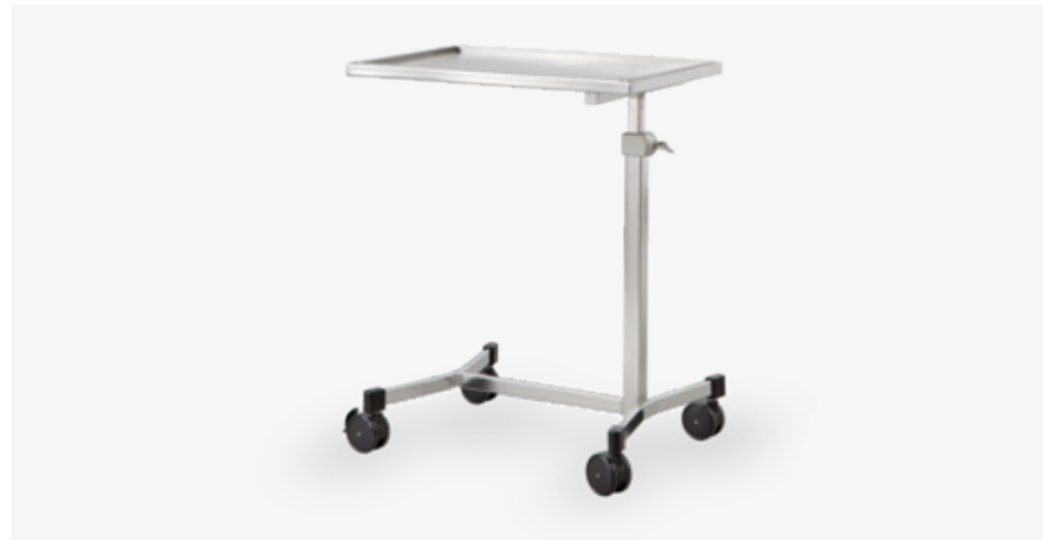
Table à instruments de chirurgie (manuel)