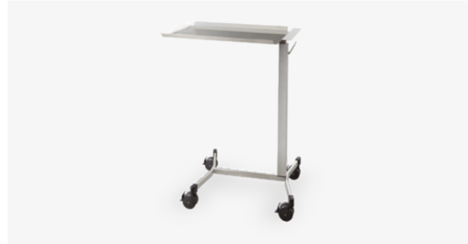
Table à instruments de chirurgie (vérin à gaz)