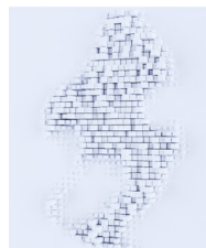
Heine Delta 30 PRO