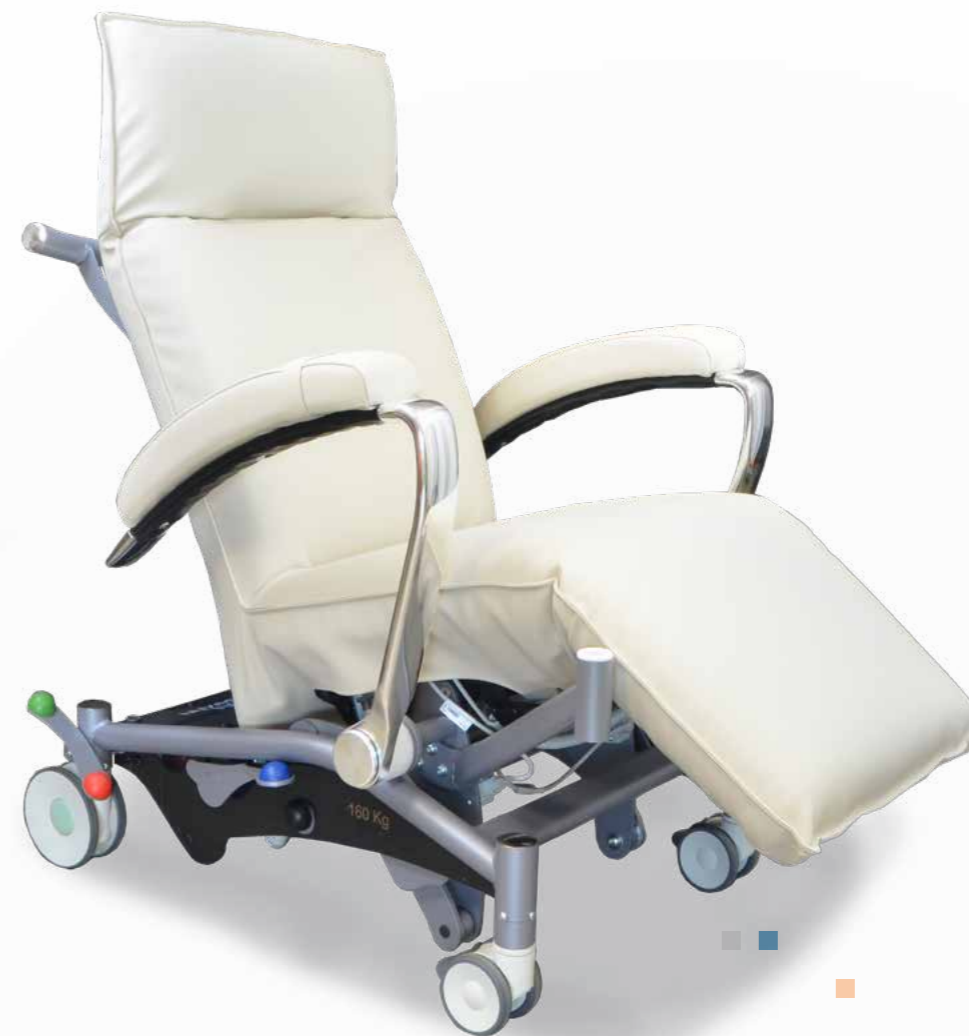
Revêtements Simili : VALENCIA M2

Alliant confort, ergonomie et esthétique, nos produits sont étudiés pour satisfaire et répondre aux besoins des patients et personnels soignants.