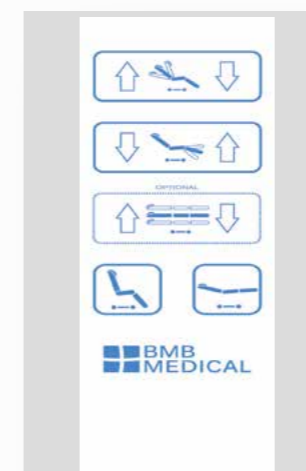
Déclive d'urgence électrique actionnée par télécommande