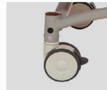
2 roues arrière Ø 125mm pivotantes, à freins indépendants