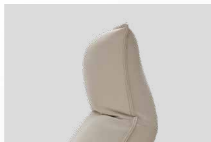
Appui-tête orientable par système à crémaillère